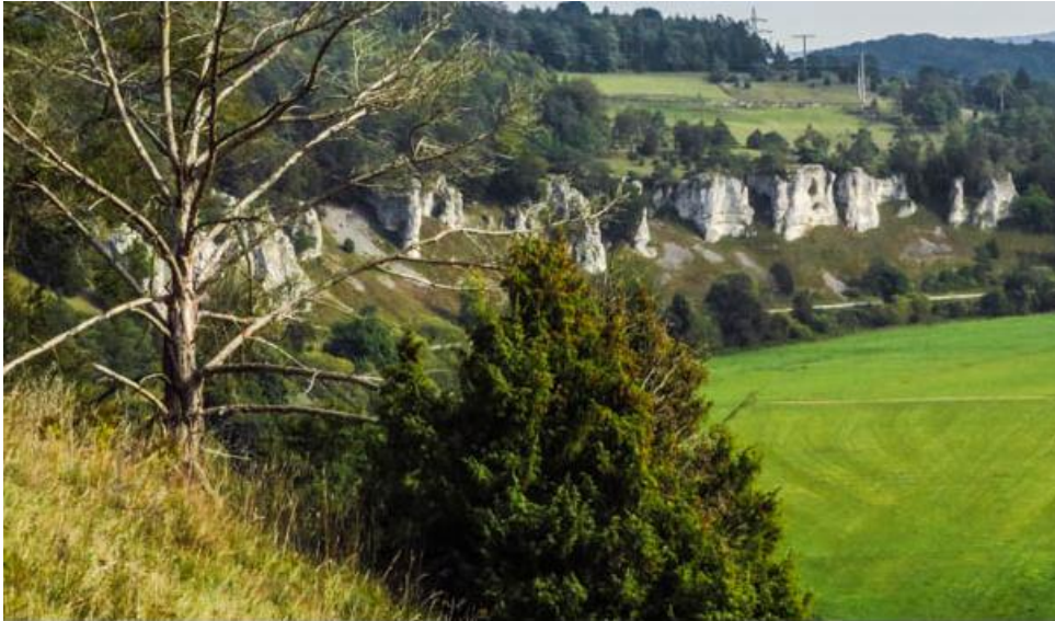
Die Zwölf Apostel, im Halbrund an einer Altmühl-Schleife angeordnet